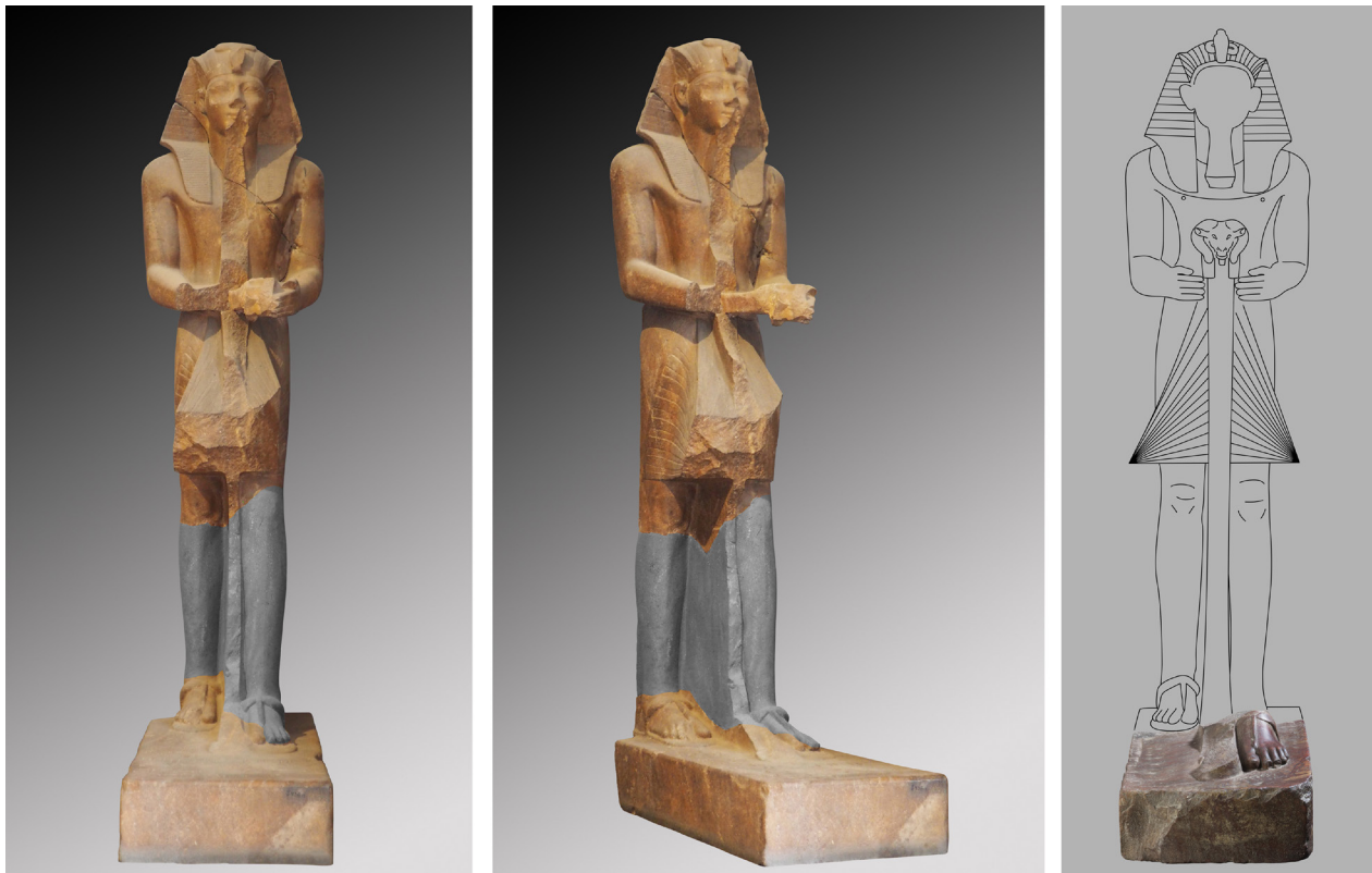
Fig. 14 : à gauche: Le Caire, JE 43611. La zone grisée correspond à la restauration moderne. à droite: Turin, Cat. 1382 (reconstitution de l'aspect originel de la statue). Dessin : Simon Connor.

sa surface supérieure, marquée de plusieurs dépressions et de lignes incisées, vestiges d'une ancienne inscription effacée. Vue depuis le dessus, la base présente également une forme irrégulière qui suggère qu'elle a été tronquée à un certain moment de son histoire : la face frontale dessine en effet un angle oblique avec les deux faces latérales, trahissant une retaille peu soignée, sans souci de mesurer les côtés de la base ni de respecter les angles droits (Fig. 12). Tous ces signes constituent des arguments en faveur d'une modification de la statue dans un but de réutilisation, selon une pratique courante à l'époque ramesside – particulièrement au cours du règne de Mérenptah.