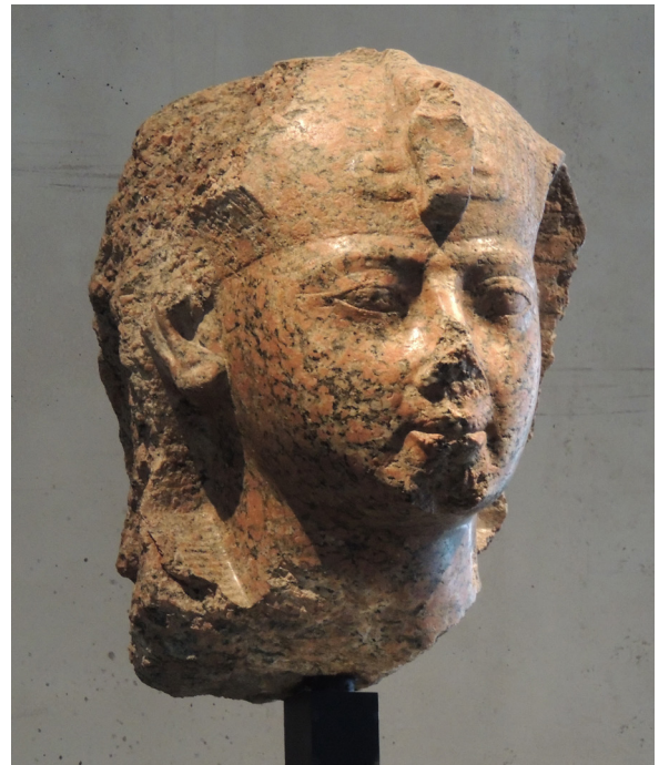
Fig. 8 : à gauche: Turin, Cat. 1381 (détails de la tête). à droite: Munich ÄS 5900. Granit. H. 53 cm. Prov. inconnue.

appartenir la tête de Munich) semble donc pouvoir être associée à la série de statues colossales en granit en position de prière érigées à Karnak par Thoutmosis III et Amenhotep II, ensemble qui devait scander le passage des processions et pétrifier l'action de dévotion du souverain. Cette série de statues, homogène dans sa conception formelle, soulève certaines questions au sujet de la pratique de l'usurpation. Il reste en effet à comprendre pourquoi, au sein d'un ensemble cohérent, certaines pièces sont restées intactes et ont conservé leur inscription originelle (les