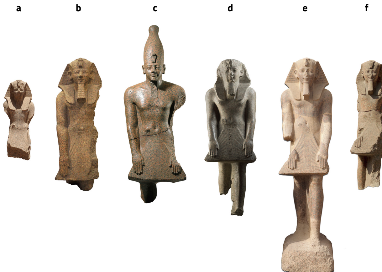
Fig. 7 : Statues de Thoutmosis III et Amenhotep II debout, en position de prière. Granit. Karnak.

à cause de sa musculature ferme et de ses épaules particulièrement développées 15 (Fig. 9). La statue de Turin (peut-être avec un jumeau auquel pourrait