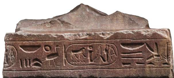
Fig. 11 : Base de statue porte-enseigne au nom de Mérenptah. Turin, Cat. 1382. Quartzite. H. 24 ; l. 55 ; P. 70 cm. Karnak. Collection Drovetti (1824).