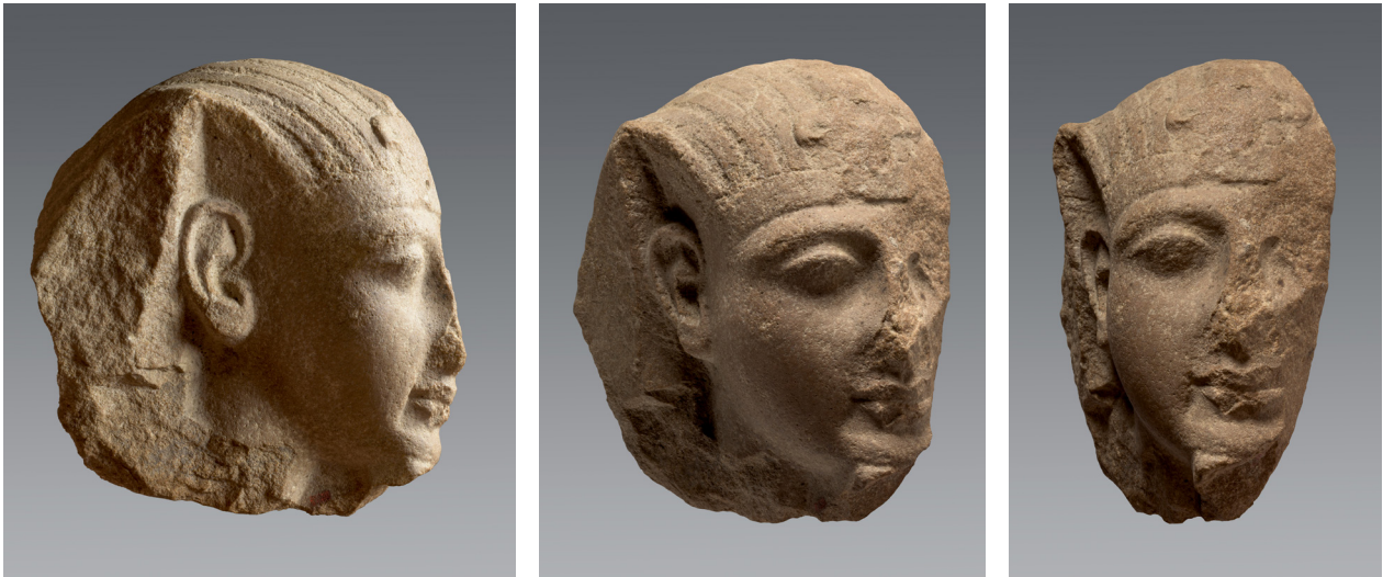
Fig. 3 : Turin, S. 2700. Quartzite. H. 25,5 ; l. 11,5 ; P. 24 cm. Héliopolis. Fouilles d'E. Schiaparelli (1903-1906).