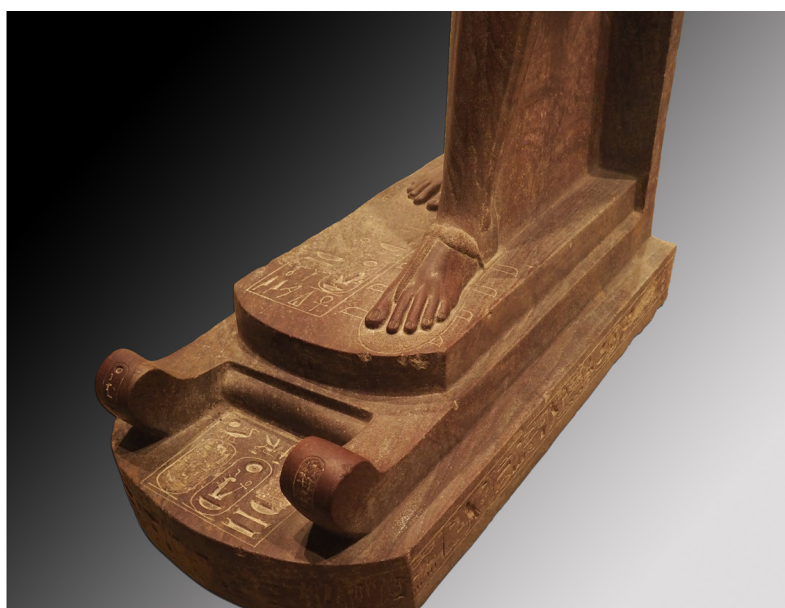
Fig. 13 : Statue d'Amenhotep III assimilé au dieu Atoum. Louqsor, musée, J. 838. Quartzite. H. 249 ; l. 54 cm. Louqsor, cachette du temple.