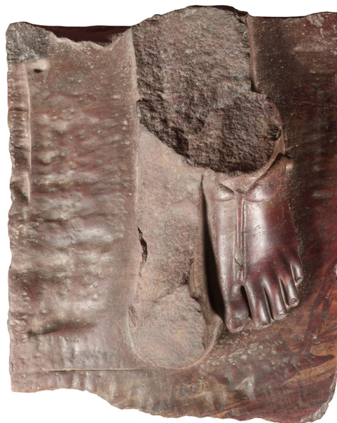
Fig. 12 : Turin, Cat. 1382.

Le pied gauche, la base d'un enseigne ou d'une table d'offrande, ainsi que le début d'une inscription sont tout ce qu'il reste de cette statue debout, suffisamment, toutefois, pour reconstituer le type statuaire auquel appartenait la sculpture, pour reconnaître qu'il s'agit d'un monument de la XVIII e dynastie usuré à l'époque ramesside et peut-être même assez pour identifier le souverain originellement représenté.