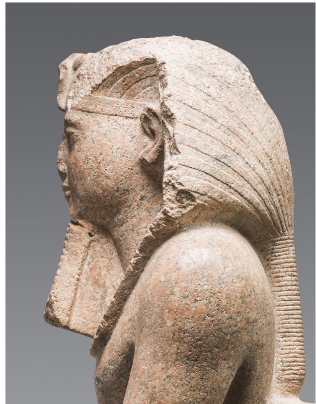
Fig. 9 : à gauche: Turin, Cat. 1381.; à droite: Karnak, cour du V e pylône, KIU 4796. Granit. H. 248 cm.

ne semblent donc pas avoir été l'objet de campagne systématiques. Peut-être dépendaient-elles de leur position au sein du temple, soit à des endroits clefs