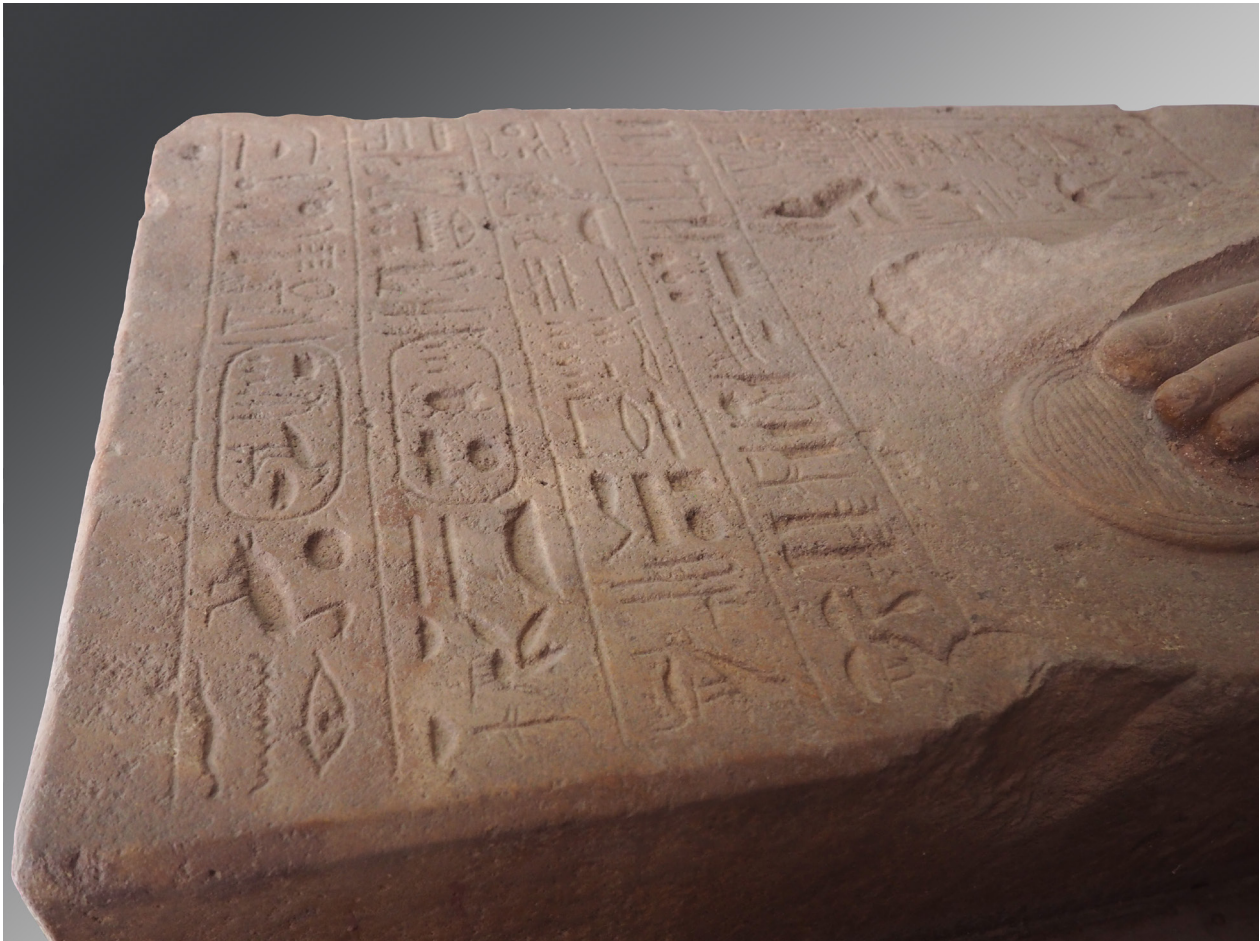
Fig. 16 : Statue porte-enseigne de Thoutmosis IV (détail de la base). Le Caire, JE 43611. Quartzite. H. 280 ; l. 57,5 ; P. 136 cm. Karnak, Ouadjyt.

piédestal rapporté par Rifaud, laisse ouvertes toutes les hypothèses. 26