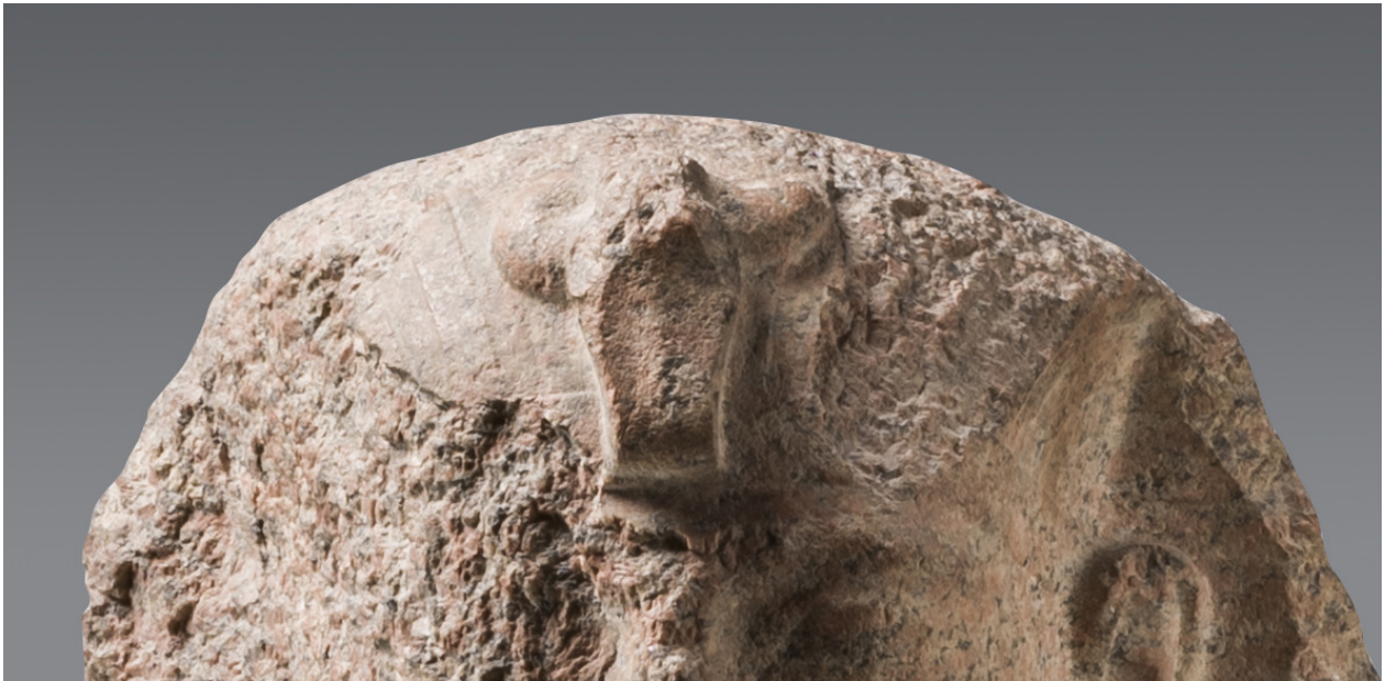
Fig. 5 : Turin, Cat. 1381 (détail de l'uræus).

originellement représenté par la statue turinoise est possible grâce à la confrontation stylistique avec le répertoire statuaire des prédécesseurs de Ramsès II.