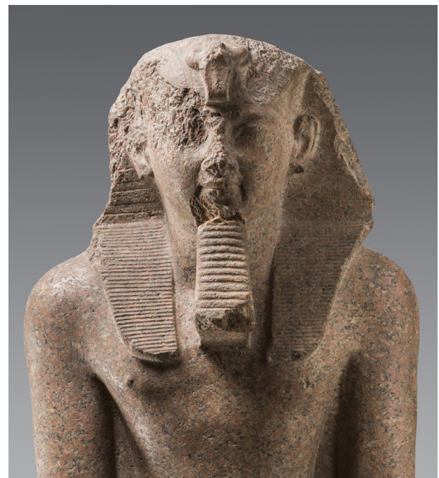
Fig. 2 : Turin, Cat. 1381 (détail du buste).

rin, dont seule une partie est reprise dans la bibliographie ci-dessus. C'est Jacques Vandier qui, le premier, propose d'y voir une statue usurpée de la XIII e dynastie, en la rapprochant des « sphinx du Delta » Louvre A 21, Le Caire JE 37478 et Boston MFA 88.747, « modelés avec vigueur et témoignant d'une certaine