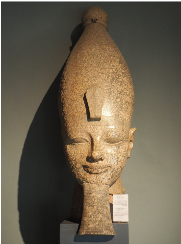
Fig. 19 : Tête d'une statue de jubilé d'Amenhotep III. Louqsor, musée, J. 133. Granit. H. 215 ; l. 78,5 ; P. 141,5 cm. Kom el-Hettan.

trouvée par Rifaud à Karnak, avec les statues royales du Nouvel Empire qui aujourd'hui trônent dans la Galerie des Rois du musée, ou si elle a été mise au