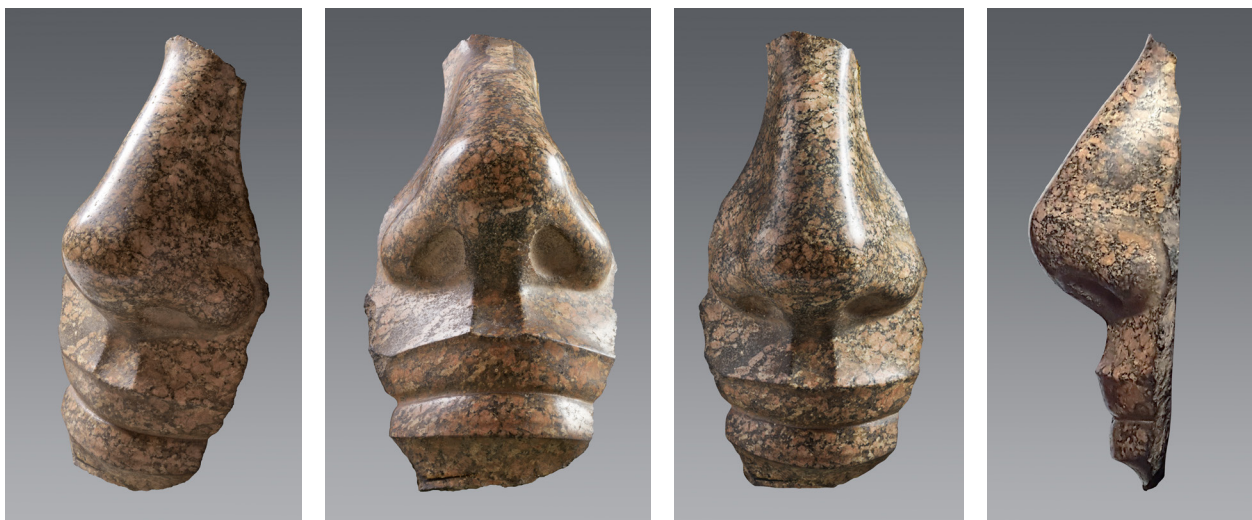
Fig. 17 : Turin, Cat. 3148. Granit. H. 44 ; l. 21 ; P. 14 cm. Kom el-Hettan ? Collection Drovetti (1824).

le nez droit au bout arrondi, les narines dilatées et délicatement ourlées, le philtrum aux arêtes bien délimitées, la bouche dessinant un sourire épanoui et la lèvre supérieure légèrement plus épaisse que la lèvre inférieure constituent des traits caractéristiques des représentations de ce souverain. 27 L'exquise délicatesse des traits et le polissage extrême de la surface du granit, dans laquelle on se reflète presque comme dans un miroir, sont propres à la statuaire colossale d'Amenhotep III, telle qu'on la retrouve sur les sites thébains : en témoignent les deux sphinx aujourd'hui sur les bords de la Neva à Saint-Pétersbourg, la série des colosses jubilaires de la cour péristyle du temple de Kôm el-Hettan 28 ou encore la tête du colosse debout du British Museum EA 15, découverte dans les ruines du temple de Mout à Karnak. 29 Le liséré contournant les lèvres, fréquent sur les statues d'Amenhotep III, est présent sur le fragment turinois, bien que seulement suggéré par une légère dépression dans le modelé, visible surtout de profil.