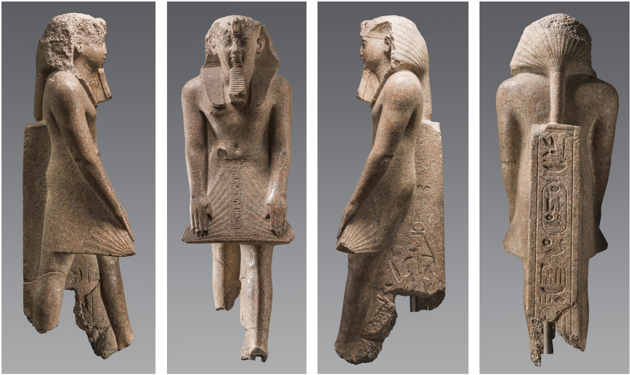
Fig. 1 : Turin, Cat. 1381. Granit. H. 220 ; l. 71 ; P. 67 cm. Karnak. Collection Drovetti (1824).

losse de Philadelphie E-635 (usurpé d'un souverain de la fin de la XII e dynastie, d'après les proportions du corps et la provenance de la statue), 3 la tête du musée de Turin trouvée lors des fouilles d'Héliopolis (Turin S. 2700, 4 cf. Fig. 3) ou le buste en granit du musée du Caire CG 38104 5 (cf. Fig. 4).