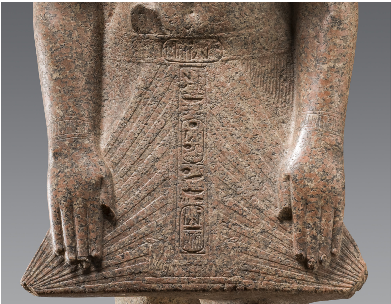
Fig. 6 : Turin, Cat. 1381 (détail du pague).

La forme statuaire, le dessin de l'uræus et le type de pague pourraient désigner à la fois la fin du Moyen Empire et la XVIII e dynastie. 9 Les proportions gé-