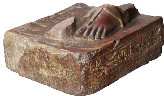
Fig. 10 : Base de statue porte-enseigne au nom de Mérenptah. Turin, Cat. 1382. Quartzite. H. 24 ; l. 55 ; P. 70 cm. Karnak. Collection Drovetti (1824).