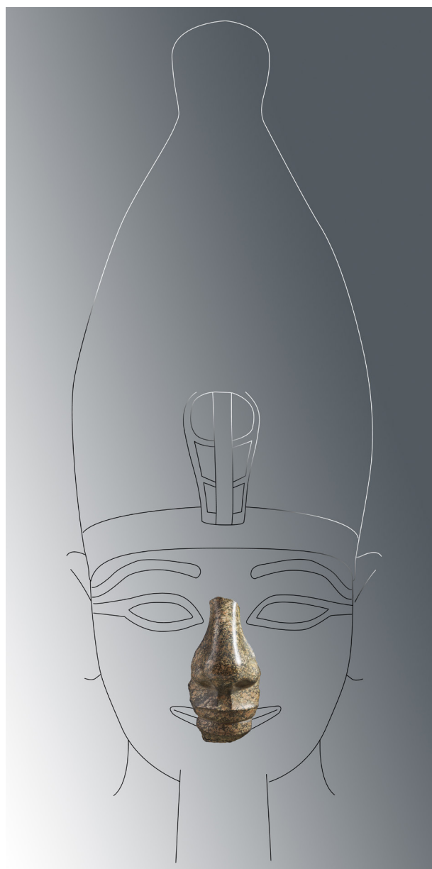
Fig. 18 : Turin, Cat. 3148. Reconstitution de l'aspect original de la tête de la statue. Dessin : Simon Connor.

L'objet est entré dans les collections turinoises lors de l'acquisition des antiquités de Drovetti, en 1824. Aucune indication n'est enregistrée à propos de sa provenance. Les dimensions de la sculpture – cinq à six fois plus grande que nature – et la similitude stylistique avec les colosses d'Amenhotep III de Karnak et de Kôm el-Hettan (Fig. 19) permettent de suggérer la région thébaine, dont provient une très grande part des antiquités collectées par Drovetti. Il est en revanche difficile de savoir si la pièce a été