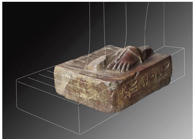
Fig. 15 : à gauche: Le Caire, JE 43611. Photographie : Simon Connor; à droite: Turin, Cat. 1382 (reconstitution de l'aspect original de la base de la statue). Photographie : Pino et Nicola Dell'Aquila/Museo Egizio.