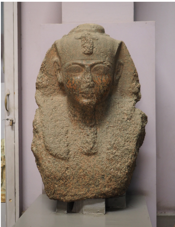
Fig. 4 : Le Caire, JE 27856 – CG 38104. Granit. H. 84,4 ; l. 60 cm. Mit Rahina, temple de Ptah. Fouilles d'A. Mariette (1892).